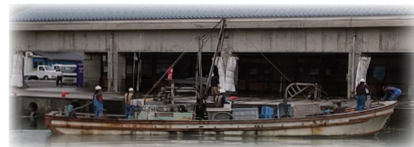
入港する定置網漁船