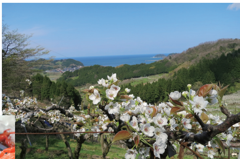
▲4月半ばの二十世紀梨畑

ゆるやかな山の斜面で、日本海からの潮風を受けて育ち、排水が良く、関西地方では香美町の香住漁港だけで水揚げされる「 香住ガニ（ベニズワイガニ） 」のカニガラを加えた有機肥料を与えた土で育つ「香住梨」は、まさに「海の恵み」を受けたおいしさがあります。