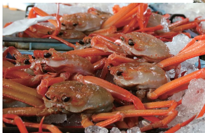
▲関西地方では香住漁港だけで水揚げされる「香住ガニ」