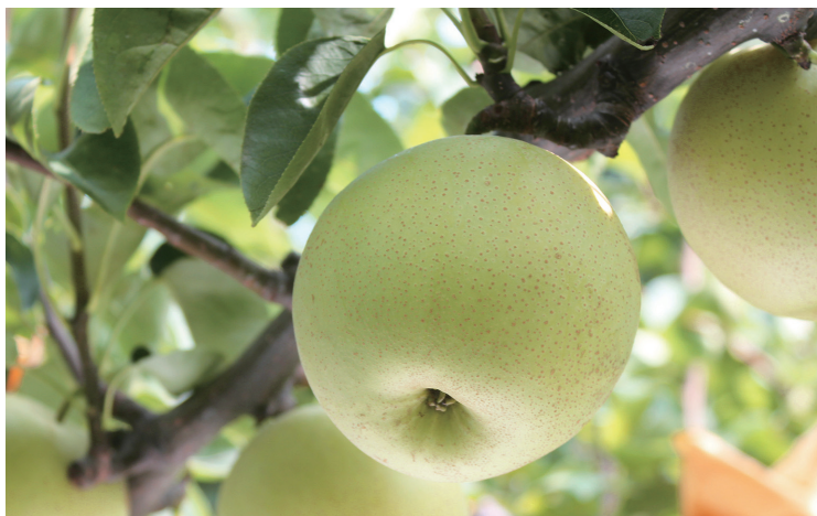
▲兵庫県のオリジナル新品種「なしおとめ」

※新しい品種のため、生産量はまだ少なく、収穫した「なしおとめ」のほとんどは、JR京都伊勢丹で行われる即売会または豊岡市のファーマーズマーケットたじまんまでの取り扱いとなります。